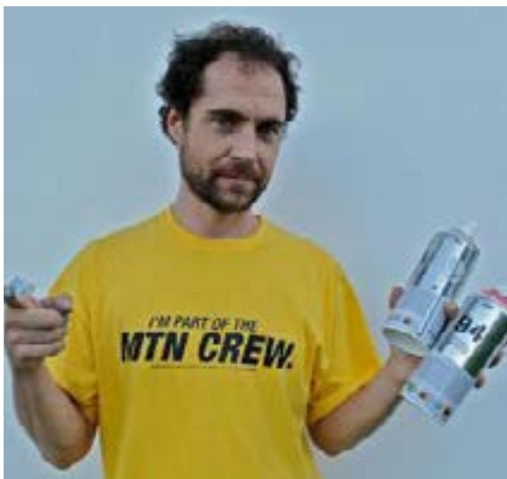
EL XUPET NEGRE

Originario de Barcelona, desde muy pequeño empezó como todo el mundo dibujando en las mesas de clase. Dedicado al mundo del dibujo y la pintura pasó muchos de sus años y sigue haciendolo como artista gráfico de la tienda ERT skatesurf shop. Se decantó por un estilo clásico en el mundo del tattoo. amante del skate desde muy pequeño este chico aprendió a ser un buen RAT de la mano de Sergi Tarré. " no es feliz el que no quiere por no saber lo que tiene "